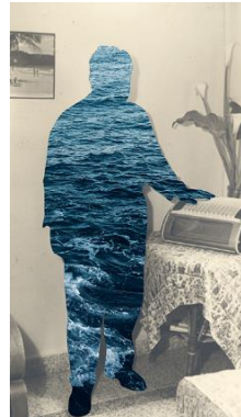
Maria Kassab, Le naufrage , 2018